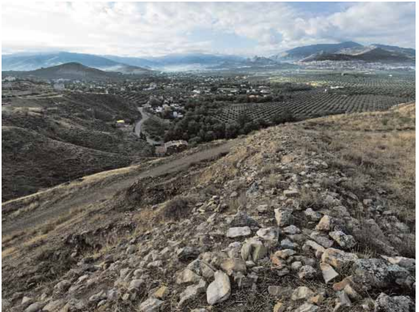
📍 Vistas desde Puente Tablas (Jaén)