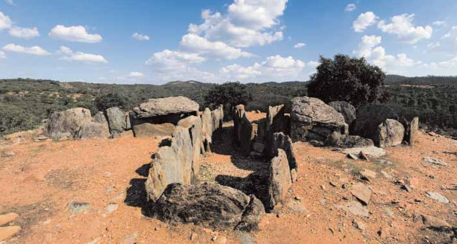
📍 Dolmen 7 de El Pozuelo (Zalamea la Real, Huelva)