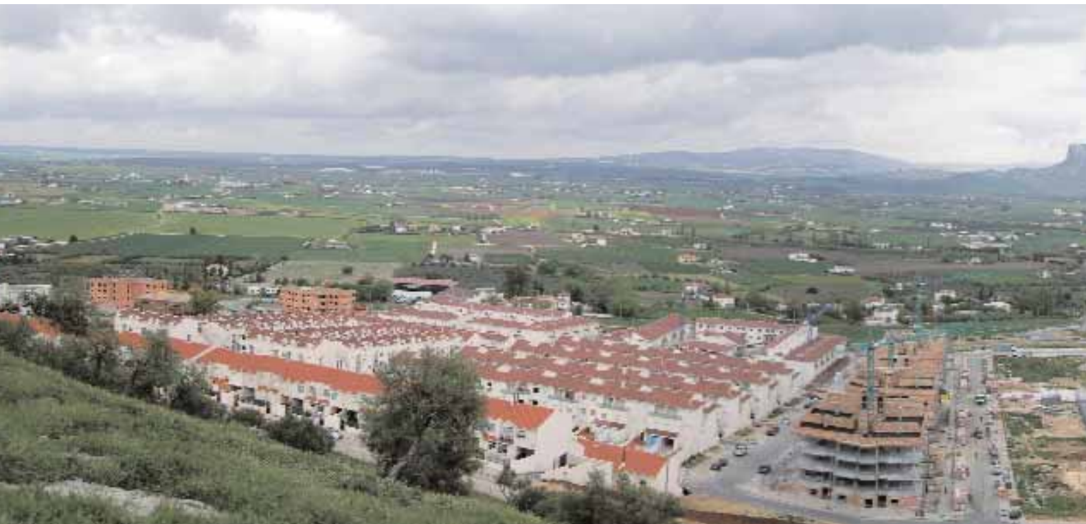
📍 Vista del Conjunto Dolménico (derecha de la imagen) en la Vega de Antequera