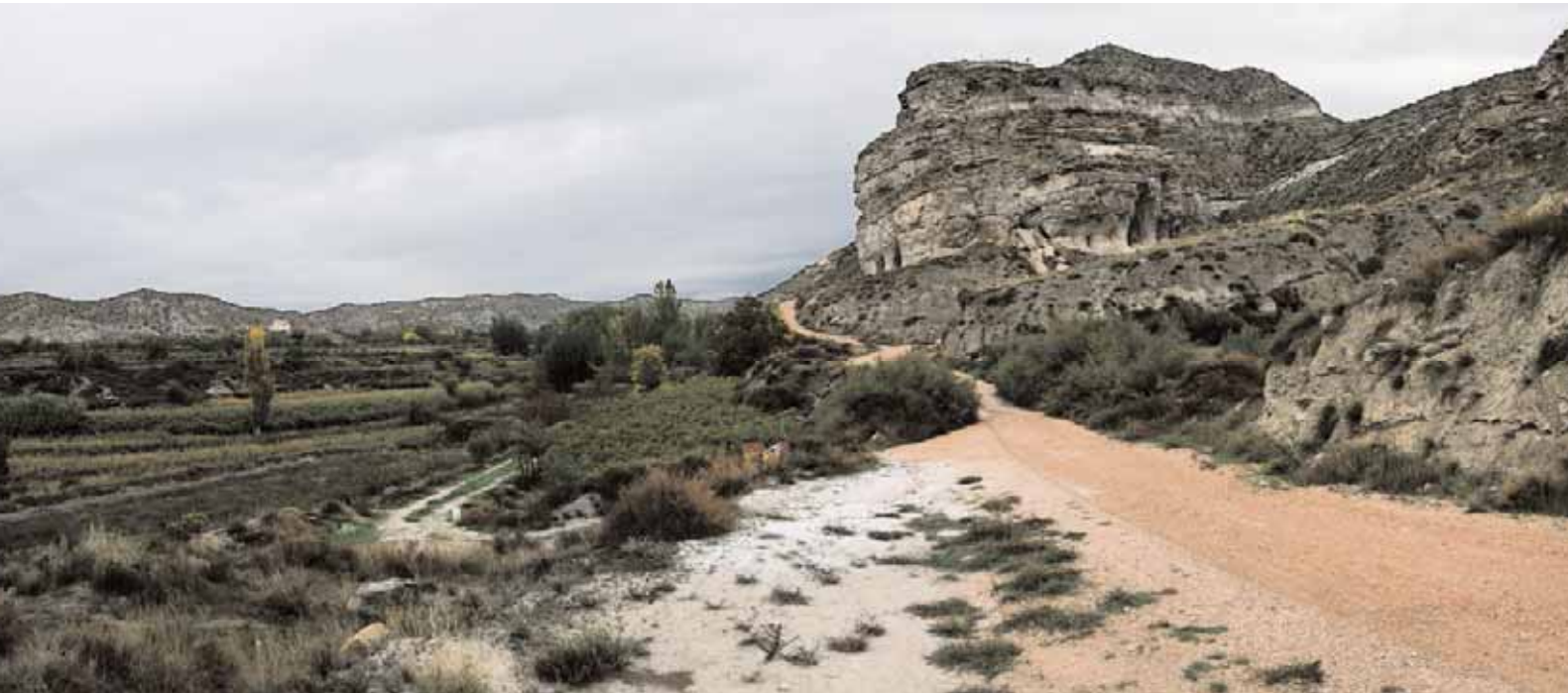
📍 Vista de Castellón Alto (Galera, Granada)