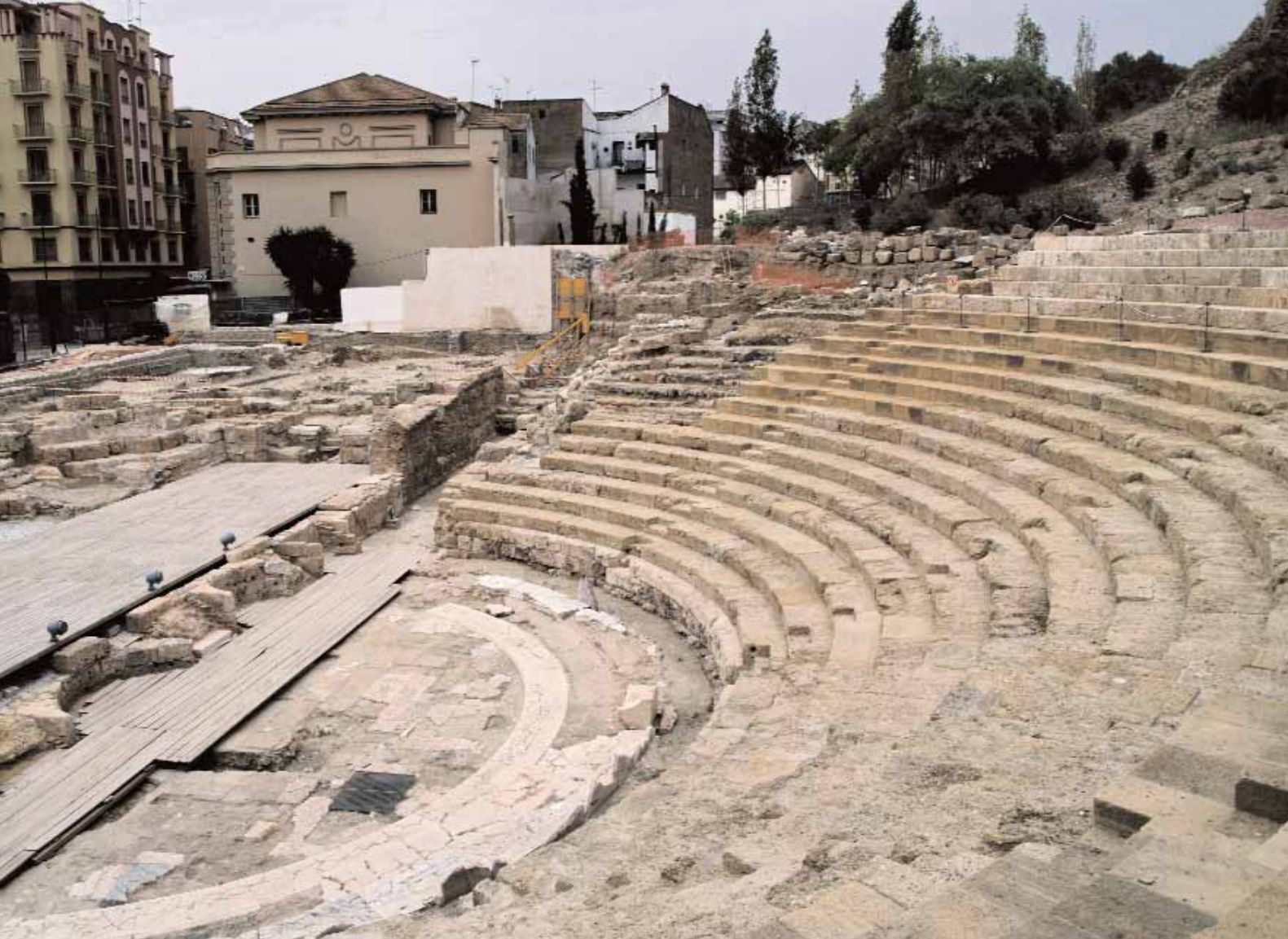
Teatro Romano de Málaga

condiciones de equilibrio sostenible no debe aceptarse como una inevitable uniformidad a la que conduce el modelo de apropiación contemporáneo basado en una coyuntura de explotación ausente en la que el capital se desentiende de los valores sociales y culturales.