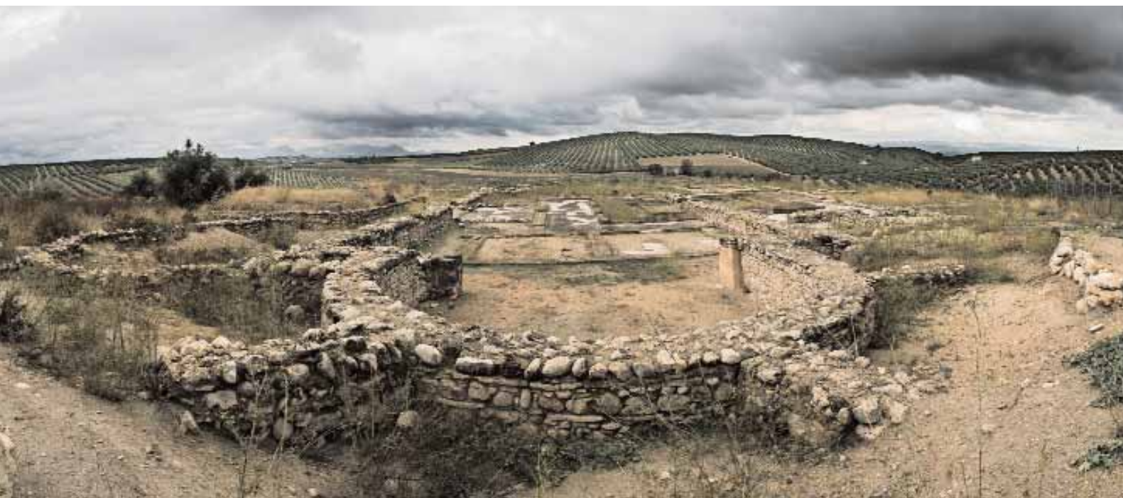
📍 Vista desde la Villa Romana de Bruñel (Quesada, Jaén)