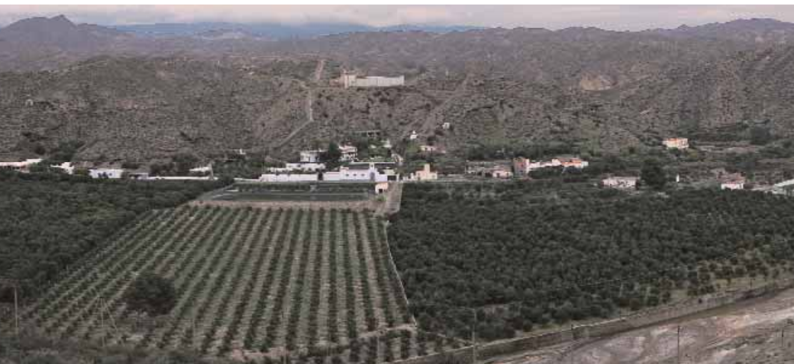
📷 Foto panorámica del cauce o rambla del río Andarax desde Los Millares (Santa Fe de Mondújar, Almería)