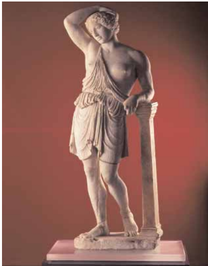
➤ Escultura de Amazona descubierta en 1998 en Écija y restaurada en el IAPH

El Instituto Andaluz del Patrimonio Histórico acogerá a finales del próximo mes de junio en su sede de Sevilla la VIII reunión nacional de restauradores de bienes culturales especializados en arqueología. La reunión bienal abordará el tema de la fragilidad del patrimonio arqueológico: su investigación, conservación, conservación preventiva e intervención. El anterior encuentro tuvo lugar en Granada.