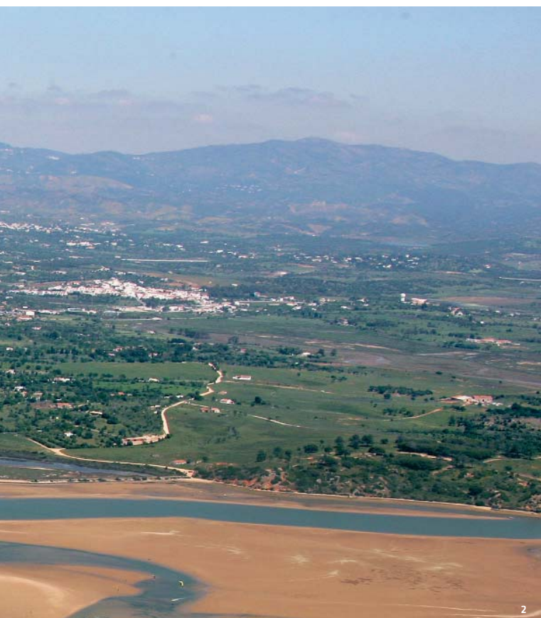
2. El entorno inmediato de Alcalar. Vista aérea desde los arenales del Alvor hacia la sierra de Monchique