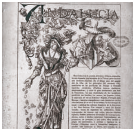
Portada de la sección de Arte de la publicación madrileña Andalucía .

Dos mil cabeceras de periódicos editados por toda España desde 1777 hasta el año 2005, con un total de 4 300 000 páginas, son ya de acceso público a través de un clic en la Biblioteca Virtual de Prensa Histórica, a la que se accede a través del portal web del Ministerio de Cultura. La Biblioteca Virtual de Prensa Histórica es resultado de un proceso de digitalización cooperativa del Ministerio, las Comunidades Autónomas y otras instituciones de la memoria, con el fin de preservar y acercar unos materiales bibliográficos que son generalmente de difícil acceso. Entre las cabeceras hay ejemplares de prensa católica, sindical, de arte y ciencia e incluso prensa clandestina. La más antigua es La pensatriz salmantina , publicación para público femenino editada en 1777.