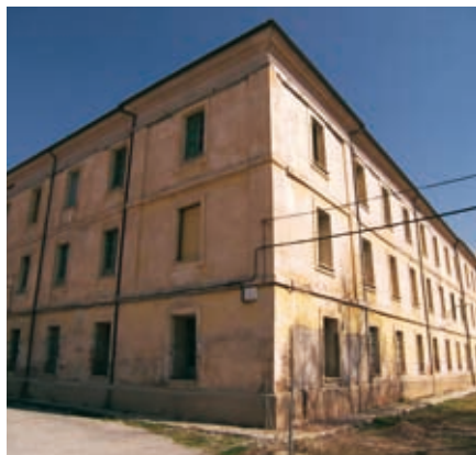
Inmueble sede del futuro Museo Nacional de Etnografía.

El futuro Museo Nacional de Etnografía tendrá sede en Teruel tras el acuerdo firmado el pasado mes de enero por el Ministerio de Cultura, el Gobierno de Aragón y Diputación de Teruel. El inmueble conocido como Antigua Casa de la Beneficiencia es el espacio elegido que albergará los fondos etnográficos actualmente adscritos al Museo del Traje CIPE (Centro de Investigación del Patrimonio Etnológico), creado en 2004 a partir de las colecciones del Museo del Pueblo Español.