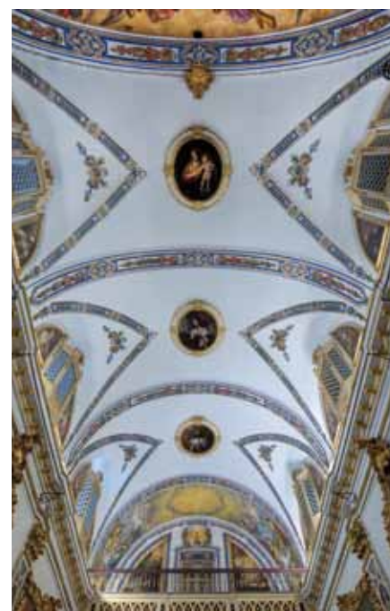
Bóveda de la capilla y programa iconográfico época romántica, 1850.

La colección sobre la que ha actuado el Instituto Andaluz del Patrimonio Histórico está formada por: