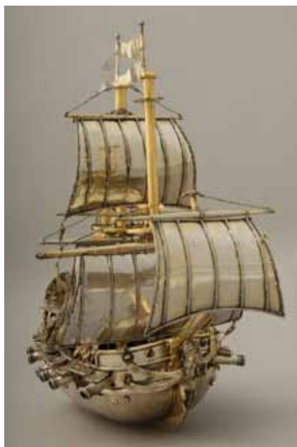
Galeón de la Virgen del Buen Aire (Juan de Garay, 1725).

El proyecto ha procurado la recuperación del programa iconográfico original de la antigua capilla y su lectura artística conforme a los postulados conceptuales y estéticos con los que fue concebida