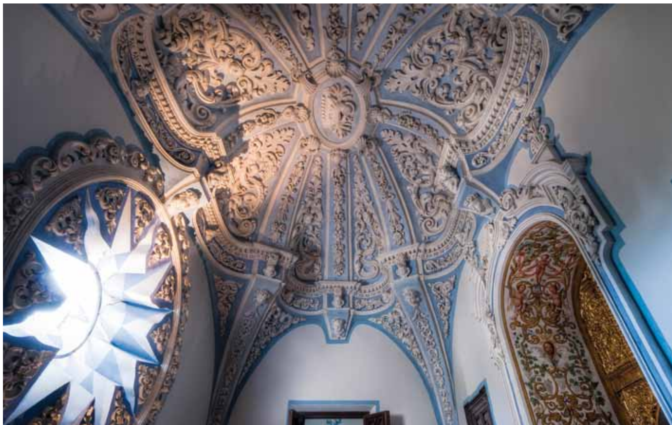
Bóveda con decoración de yeserías en el camarín alto (Antonio Matías de Figueroa y Domingo Martínez, 1724-5).