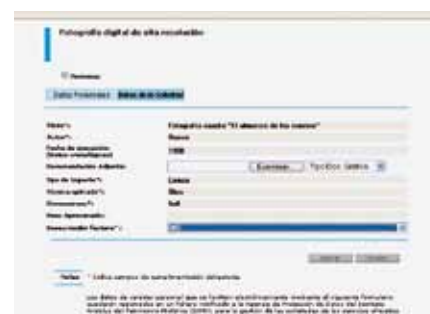
Formulario de solicitud en línea de servicios