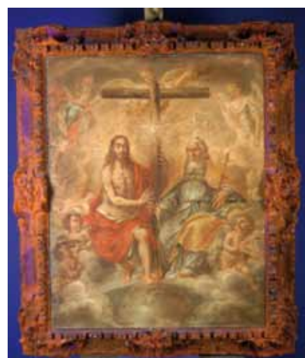
Técnica ultravioleta.

En adelante, el IAPH se plantea entre sus objetivos fundamentales continuar trabajando en la mejora de nuestros servicios y productos de información, con intención de adaptarse a las necesidades emergentes de nuestros usuarios y a las nuevas tendencias en gestión de servicios en línea. Asimismo, la institución pretende ofrecer el mayor número posible de nuestros servicios a través del portal web y automatizar el mecanismo de solicitud, con objeto de facilitar el acceso a todos los ciudadanos.