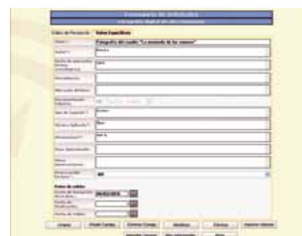
Sistema Integrado para la gestión de los servicios del IAPH