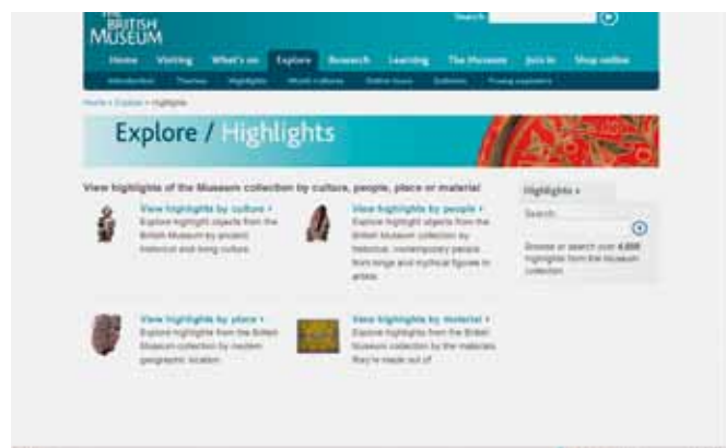
Documentación de colecciones. British Museum: www.britishmuseum.org/explore/highlights.aspx