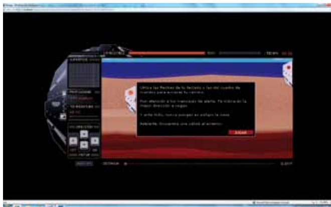
Juegos virtuales. CosmoCaixa Barcelona: obrasocial.lacaixa.es/nuestroscentros/cosmocaixabarcelona/cosmocaixabarcelona_es.html

PH: ¿Cree que las instituciones patrimoniales (archivos, bibliotecas, centros de documentación, museos, espacios culturales...) incluyen entre sus prioridades la aplicación de las TIC y que, por tanto, destinan los suficientes recursos económicos y humanos para emprender actuaciones relacionadas con las tecnologías de la información? Desde las perspectivas del tiempo y la situación en las diferentes comunidades autónomas ¿cómo observa la cuestión?