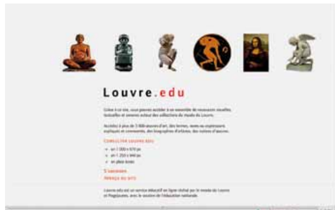
Escenas de aprendizaje interactivo. Musée du Louvre: www.louvre.edu/index_louvre.php

PH: Usted ha participado en el estudio para el diseño de un título de grado en el ámbito de las Humanidades, en el marco del Espacio Europeo de Educación Superior (EEES). En general, ¿qué oportunidades y amenazas supone la im-