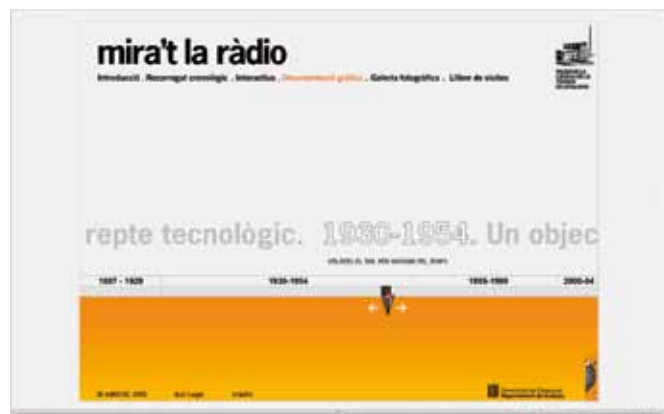
Virtualidad complemento de la presencialidad. Museu de la Ciència i de la Tècnica de Catalunya: www.mnactec.cat/virtual/radio/home.html