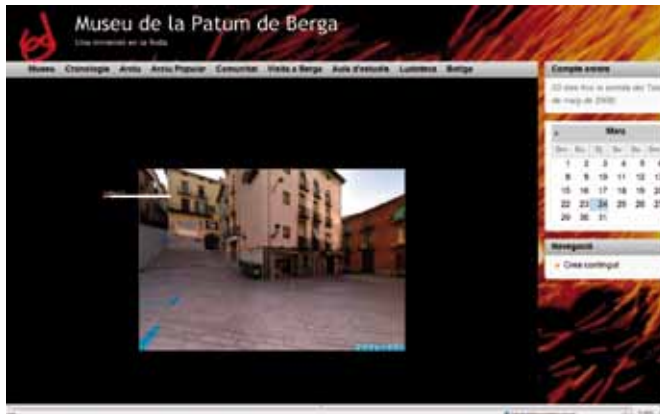
Mundos virtuales. Museu de la Patum de Berga: www.museu.lapatum.cat