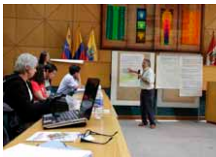
Uno de los numerosos encuentros que se organizaron durante el Taller.

que participarán varias instituciones como el CONESUP, Universidad Salesiana, SENACYT, entre otras.