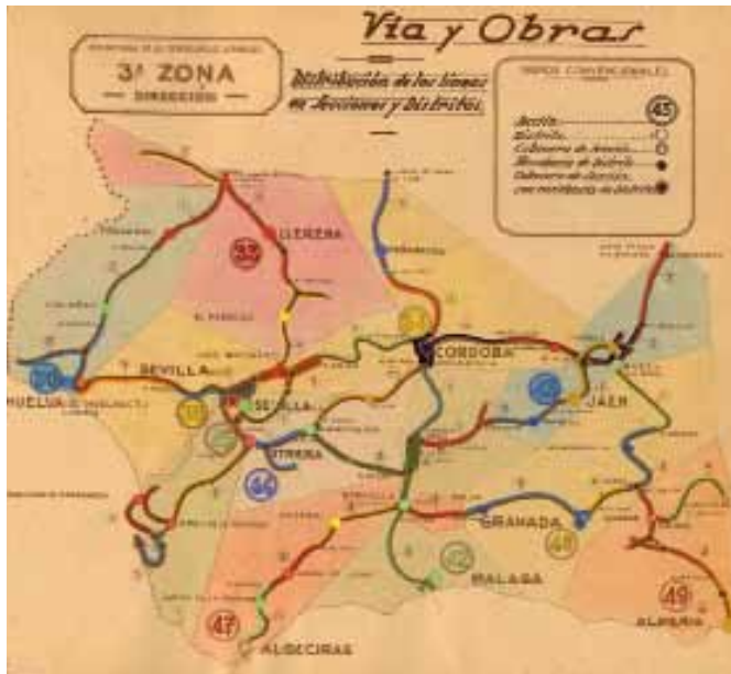
Mapa de la organización del Servicio de Vía y Obras en la Tercera Zona de RENFE, año 1948.

idad el más importante archivo español sobre las empresas ferroviarias que operaron en nuestro país en el denominado periodo privado. El ingreso de los fondos se produjo, fundamentalmente, en el momento de su constitución. A estos se añadieron otros fondos que la empresa estatal ferroviaria consideró en ese momento como merecedores de tal fin.