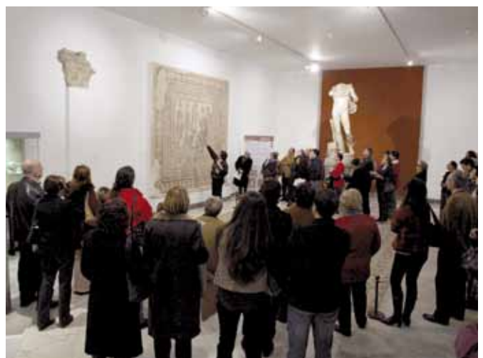
Prospección, excavación, rehabilitación y difusión. Una visión a cuatro bandas de la arqueología.