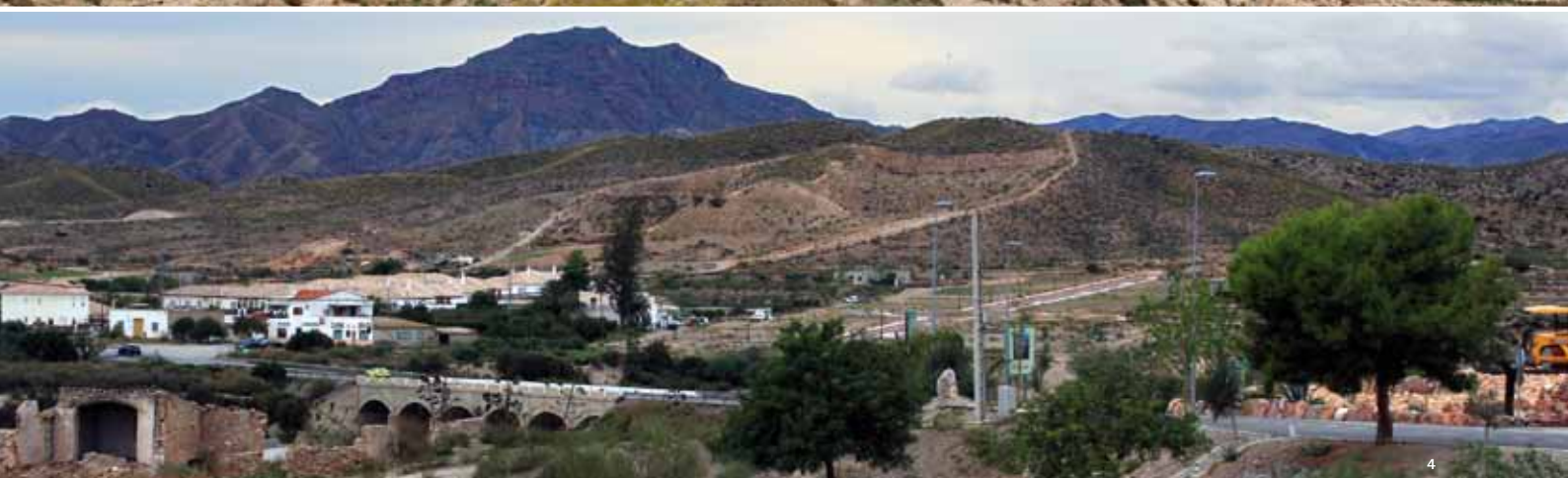
1. Fundación La Invencible