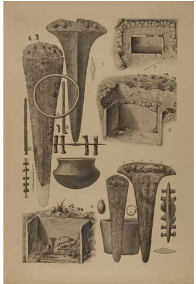
Planos y ajuares de las sepulturas 1 y 18 de la necrópolis de Fuente Álamo, incluidos en la misma publicación

se han realizado diversas obras de consolidación de los hipogeos, de cerramiento y señalización de la necrópolis y de construcción de un centro de recepción de visitantes. También se acometió un importante programa de restauración de la casa de Luis Siret entre 1993 y 1998 (SUÁREZ MÁRQUEZ, 2011).