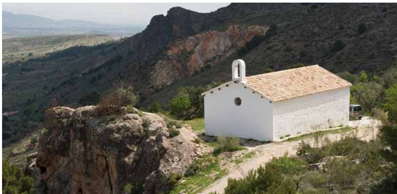
Ermita de la Virgen de la Cabeza (Serón).

Servicio de Protección del Patrimonio Histórico Dirección General de Bienes Culturales