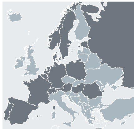
Países participantes en Wiki Loves Monuments 2011.

La edición 2011 del concurso Wiki Loves Monuments, organizado por quince países europeos con el objetivo de despertar interés por los monumentos existentes, finalizó el pasado 30 de septiembre. De las 168.144 fotos participantes, 16.976 (10.1%) corresponden a bienes de interés cultural de España con categoría de monumento. En nuestro país el concurso está organizado por Wikimedia España, con la colaboración de la asociación Amical Viquipèdia. Para ello se creó una web con toda la información relacionada.