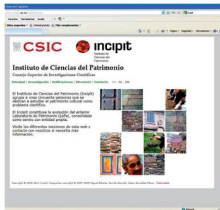
Página de inicio de la web del Instituto de Ciencias del Patrimonio disponible en tres idiomas

Recientemente, el Laboratorio de Patrimonio LaPa (unidad de investigación del CSIC, radicada en el IEGPS en Santiago de Compostela) se ha incorporado, como núcleo fundacional, al nuevo Instituto de Ciencias del Patrimonio, Incipit (que el Consejo decidió crear y ubicar en esa misma ciudad).