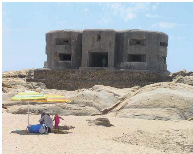
Búnkeres en la playa de los Lances (izquierda) y en la playa del cabo de la Plata.