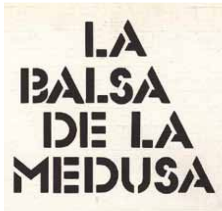
Detalle de la portada del número 1 de la revista La Balsa de la Medusa (1987).

Desde el pasado mes de octubre, revistas como Leviatán o La balsa de la medusa pueden descargarse y leerse sin restricción en la página web de la Biblioteca Virtual de Prensa Histórica (BVPH). De acuerdo con las recomendaciones de la Comisión Europea, que promueve la digitalización de contenidos actuales, el Ministerio de Cultura ha firmado un acuerdo con ARCE (Asociación de Revistas Culturales Españolas) para hacer accesibles los contenidos de revistas asociadas a esta entidad.