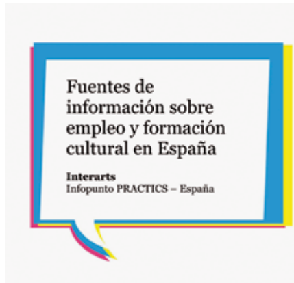
Portada del documento

Es un documento breve y lleva por título Fuentes de información sobre empleo y formación cultural en España. Y ésta es la dirección desde la que puedes descargarlo: http://www.interarts.net/descargas/interarts919.pdf