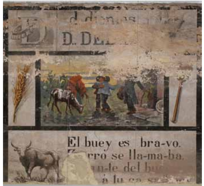
Repertorio gráfico correspondiente a la letra D