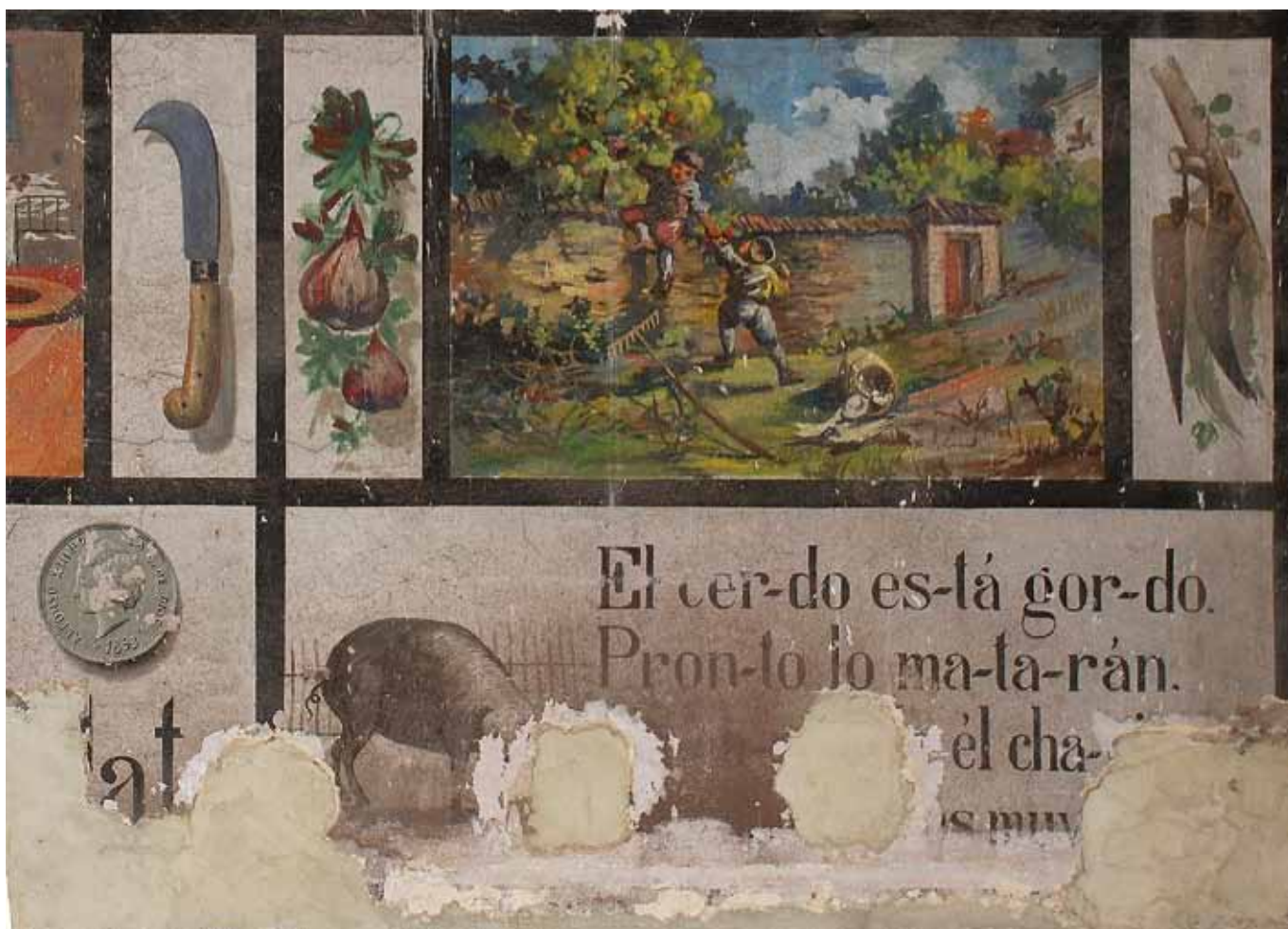
Detalle de los daños provocados por la colocación de las vigas de sustentación del falso techo.