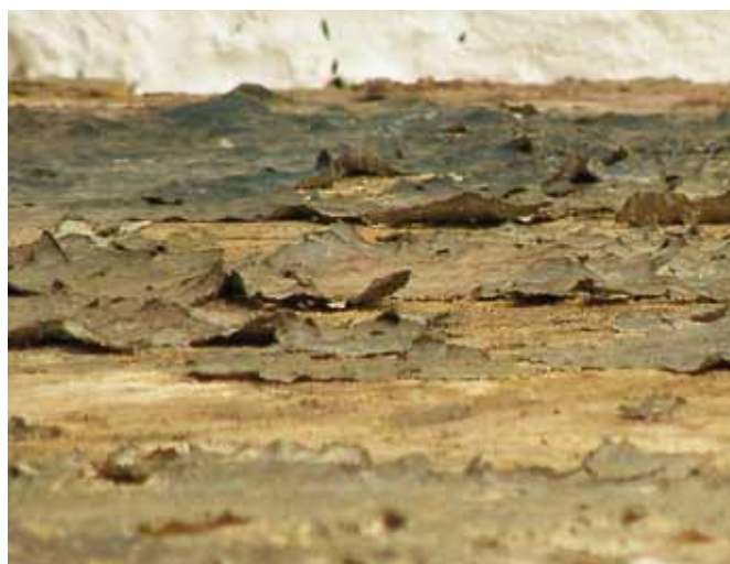
Fotografía rasante sobre el friso de los fenómenos atmosféricos que muestra la descohesión de la película pictórica respecto al muro y el peligro de nuevas pérdidas en ascenso.