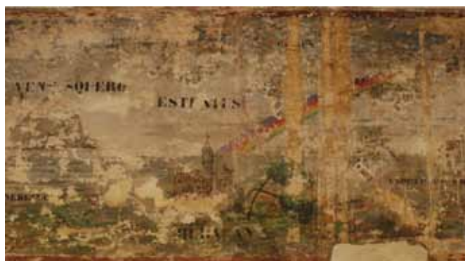
Detalle del friso de los fenómenos atmosféricos, con evidentes muestras del arrastre de la capa pictórica por infiltraciones de agua y grandes lagunas derivadas de otras patologías asociadas