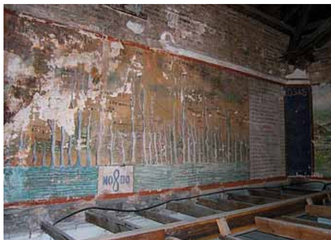
Los frisos pictóricos descubiertos sobre los falsos techos.

Cronograma histórico sobre la edificación, las remodelaciones y su repercusión en las pinturas murales de los Altos Colegios Macarena. Cronograma: Alfonso Buendía Martos, Teresa Rodríguez García