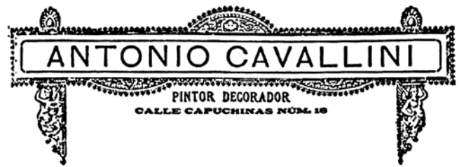
Imagen del logo de Cavallini.

Las filtraciones de agua procedente de las cubiertas provocaron evidentes arrastres en la capa pictórica que demuestran cómo el procedimiento es soluble en agua tras su secado. Debido a esta capacidad de disolución podríamos descartar el uso de los procedimientos pictóricos grasos.