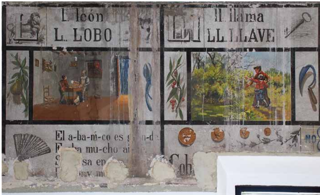
Dos de los casetones del abecedario con distintos grados de pérdidas