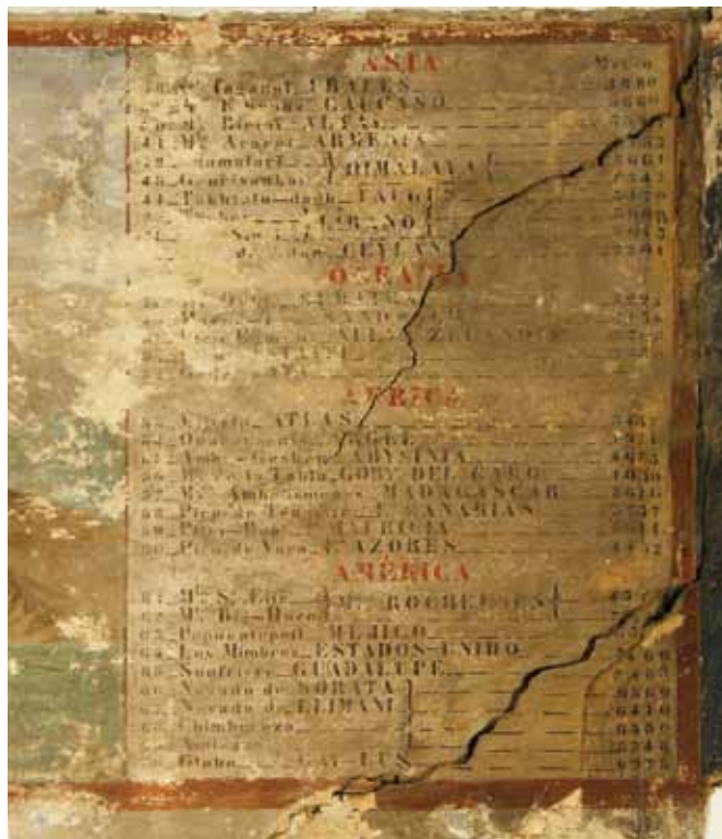
Detalle del friso de los montes con grietas de consideración sobre el muro, lagunas en los estratos pictóricos y depósitos de polvo y suciedad superficial

Si hacemos una rápida síntesis de los daños detectados, podemos constatar distintos tipos de alteraciones que inciden de forma muy negativa en la lectura: grietas en el muro, pérdida de cohesión en la pintura y enlucidos, levantamientos y lagunas asociadas, arrastre de materia pictórica, restos de morteros de cemento como reparación, capas de pintura cubriendo restos originales, arañazos y golpes, suciedad superficial... se localizan de forma heterogénea en todos los paramentos decorados.