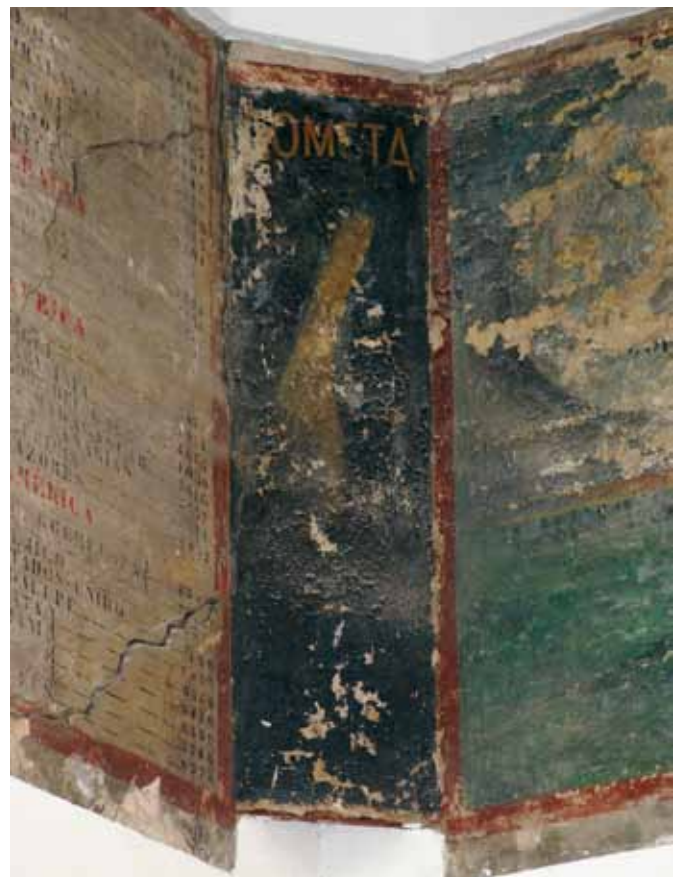
Detalle de uno de los chaflandes pintados con los motivos de las constelaciones.