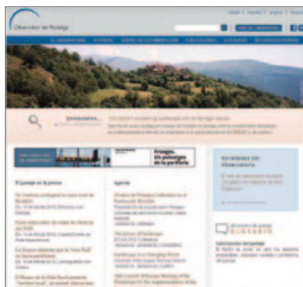
Página de inicio de la web del Observatorio del Paisaje de Cataluña

La fecha límite de entrega de candidaturas será el 2 de noviembre de 2012, según el procedimiento establecido en las bases de la convocatoria.