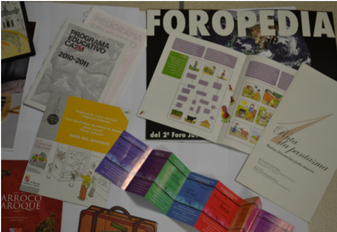
Materiales didácticos elaborados por diversas entidades e inventariados en el Observatorio

sobre aprendizajes significativos, puesto que los contenidos tendrán que engarzarse con los esquemas de conocimiento previos del alumno para adquirir sentido. El proyecto Historias paralelas, se inscribe en el marco de este modelo, que surgió de la colaboración entre las Escuelas de Arte de Zamora y Álava.