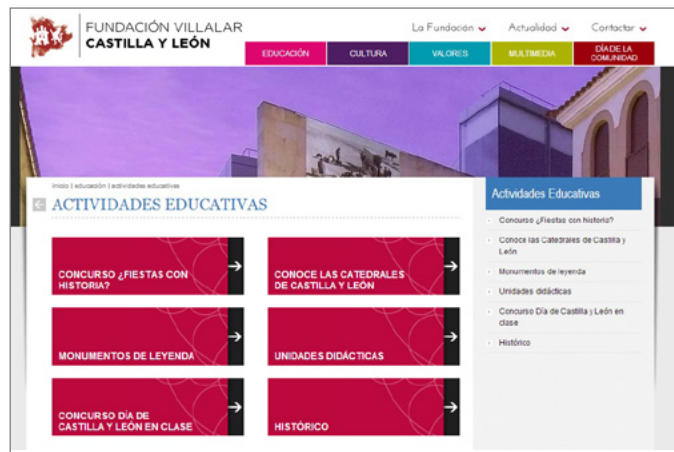
Portal web de la Fundación Villalar de Castilla y León