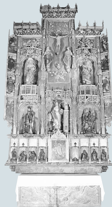
I. Málaga. Catedral. Retablo de Santa Bárbara. Hacia 1524

El número total de bienes inventariados en la Catedral de Málaga asciende a 1777 distribuyéndose cronológicamente desde finales del siglo XV hasta los principios del siglo XX. La pieza más antigua de las inventariadas es la Virgen de los Reyes, escultura de estilo gótico y origen castellano datable en la década de 1480. Según la tradición pertenecía a la reina católica y era custodiada en el oratorio de su tienda, debiendo quedarse en la ciudad tras su conquista en 1487. El número mayor de bienes corresponden a los siglos XVII y XVIII, reduciéndose casi a la mitad las piezas de los siglos XVI y XIX.