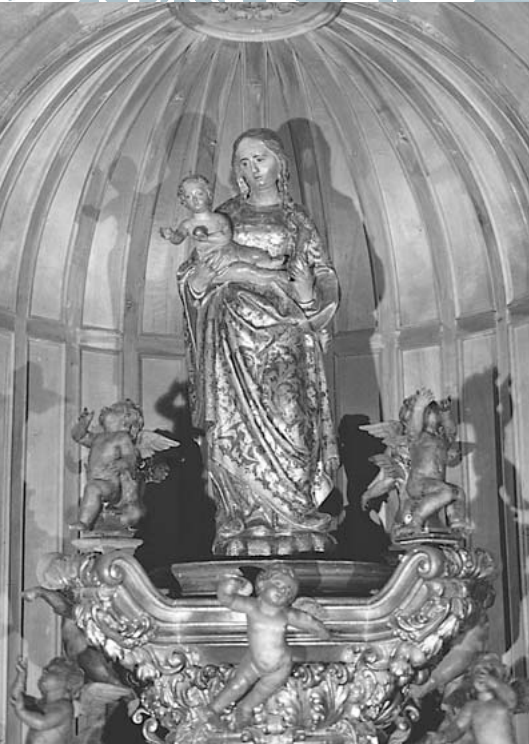
2. Málaga. Catedral. Virgen de los Reyes. 1480-1490

Estilísticamente el mayor número de piezas corresponde al momento barroco habiéndose catalogado cerca de setecientas cincuenta piezas, ochenta y seis correspondientes al periodo renacentista y noventa al neoclásico distribuyéndose el resto dentro de muy diversos periodos.