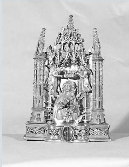
4. Málaga. Catedral. Museo. Portapaz gótico. 1490-1500

El programa de inventariación ha permitido conocer la necesidad de proceder a la restauración de una forma rápida de un total de ciento cincuenta y ocho piezas algunas de las cuales ya lo están siendo como ocurre con el retablo de Santa Bárbara.