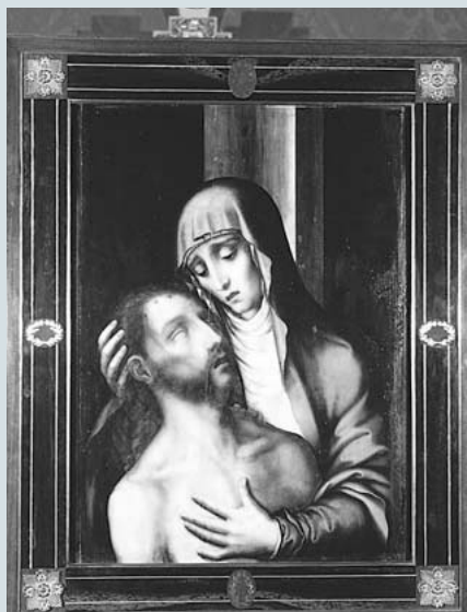
3. Málaga. Catedral. Sala Capitular. Piedad. Siglo XVI. Obra de Luis de Morales

Tipológicamente se han inventariado diecisiete retablos, doscientos dieciocho lienzos, ciento cincuenta y dos esculturas, ciento setenta y ocho piezas de platería y un largo etcétera de las más diversas tipologías.