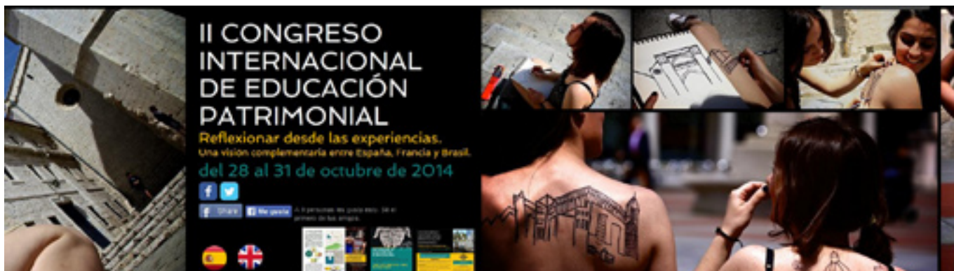
Detalle de la web del II Congreso internacional de educación patrimonial