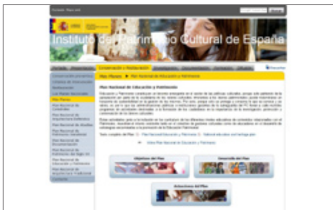
Web del Plan Nacional de Educación y Patrimonio