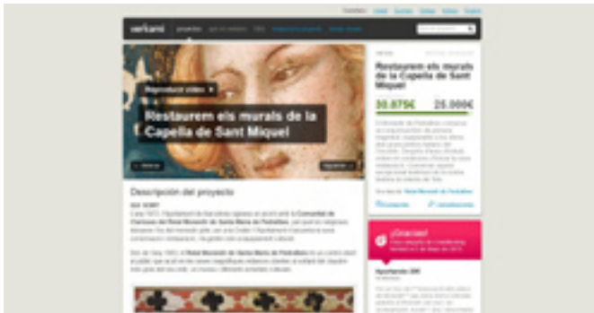
Restauración de las pinturas murales de la capilla de San Miguel < http://www.verkami.com/projects/4904-restaurem-els-murals-de-la-capella-de-sant-miquel >