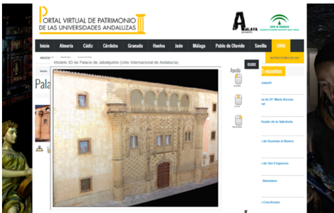
Modelo 3D de la fachada del palacio de Jabalquinto (UNIA)