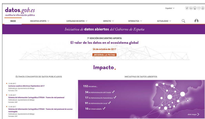
Iniciativa de datos abiertos del Gobierno de España ( http://datos.gob.es/ )

des culturales de la localidad y su consecuente análisis para procesos de planificación o toma de decisiones.