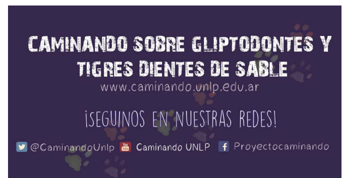
Caminando sobre gliptodontes y tigres dientes de sable en redes sociales

individuos, ponemos en juego a los fósiles como bien patrimonial. Concluimos que un objeto cobra valor patrimonial cuando se comparte, es reconocido y sentido como propio por la comunidad. Esto es la base y razón por la cual las personas nos sentimos parte de un conjunto mayor que llamamos sentido de pertenencia; que puede ser local, nacional e incluso mundial. Así, el patrimonio juega un rol importante en nuestra identidad y su fuerza no proviene del objeto, sino de las personas que se apropian de él (SALGADO-AHUMADA; MONTERO; IACONA et ál., 2017). Apropiamos del patrimonio es hacer parte de nosotros aquello que tiene un valor para la comunidad, entendiendo que no todos tenemos los mismos roles u obligaciones. Por ejemplo, los paleontólogos tienen responsabilidad en el descubrimiento, conocimiento, resguardo y divulgación de los fósiles; las instituciones deben trabajar junto a la comunidad local para darle valor educativo e identitario y velar por su cui-