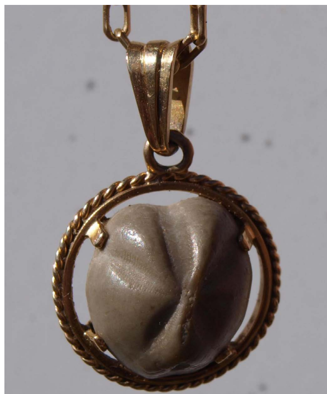
Ejemplo de uso apotrópico: peculiar joya religiosa elaborada hacia 1998 por un joyero de Soria, con un ejemplar de erizo marino fósil ( Mecaster scutigera ) del Cretácico, recogido por una devota en las inmediaciones de la ermita de la Virgen de Inodejo, en Las Fraguas (Soria). En montura de plata sobredorada para ser llevado colgando del cuello. La propietaria es una señora mayor de Nódalo (Soria). Son llamados popularmente piedrecitas de la Virgen, tradicionalmente se le atribuyeron origen prodigioso y milagrosas virtudes protectoras por lo que se recogían el día de la romería patronal | foto J. Soria, 2012

La difusión pública por Internet de los primeros planteamientos teóricos, resultados o conclusiones y propuestas iniciales se inicia cuando ya se disponía de abundantes casos localizados y estudiados, con infinidad de datos recopilados que confirmaban predicciones, facilitaban establecer tipologías, validaban hipótesis iniciales y permitían construir un marco general de referencia. El idioma utilizado ha sido el español por ser la Península Ibérica el territorio estudiado y por disponer