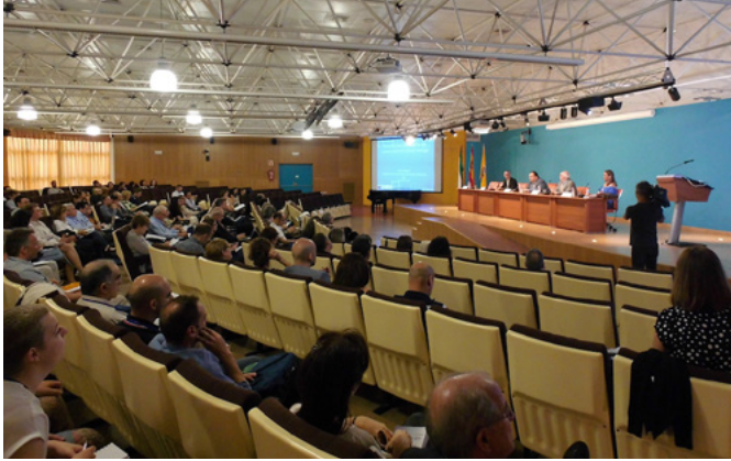
Ceremonia de apertura del III Congreso Technoheritage, 21 a 24 de 2017, Cádiz