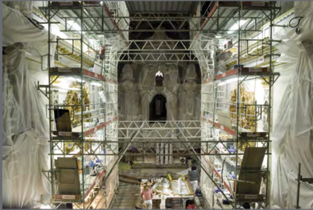
Proyecto de intervención del IAPH de los bienes culturales del Palacio de San Telmo.

"La articulación del IAPH y su Centro de Intervención se define claramente dentro del perfil de revista PH demostrativo de la labor institucional"