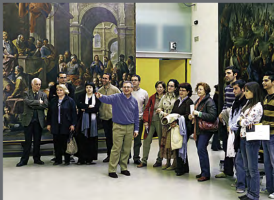
Visita guiada en el taller de pintura del IAPH.

"El referente del IAPH no tiene más que progresar. Para ello, es conveniente asumir la conveniencia de liderar proyectos de investigación según intereses del marco europeo, la internacionalización de la producción de sus investigadores y técnicos y una revista PH que incluya el inglés"