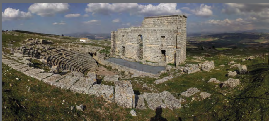
La restauración del teatro romano de Acinipo (Ronda) no solo consolidó un objeto. Aseguró la percepción de este enclave arqueológico, que hoy día propicia la comprensión de un paisaje cultural.

Otro escenario de planificación se va a producir en esos años. El IAPH construye un programa de formación con una batería de cursos que se complementa con los convenios firmados en 1995 con la Universidad de Sevilla para impartir títulos propios de máster, inicialmente Máster en Arquitectura y Patrimonio Histórico (MARPH), en Archivística (MARCH) y en Información y Documentación (MIDUS). Luego fueron acompañados por el dedicado a museos de la Universidad de Granada o el de gestión cultural, entre otros. Hoy en día solo continúa, y adaptado al Espacio Europeo de Educación Superior como título oficial, el Máster en Arquitectura y Patrimonio Histórico, de cuya larga evolución y de la problemática de formación de los técnicos en patrimonio la revista PH ha mostrado varios artículos a lo largo de su recorrido.