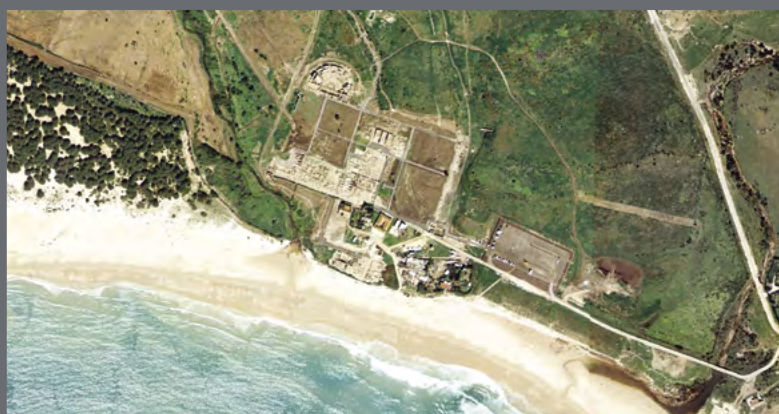
Acciones en el paisaje cultural de la ensenada de Bolonia.

"La labor afrontada con la ensenada de Bolonia, que germina en una guía de su paisaje cultural, pondrá a punto una metodología que define la personalidad con la que el IAPH se formula en este tiempo, en cuanto a estructura de trabajo"