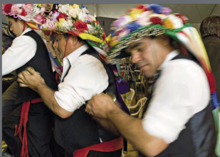
Proyecto Atlas del Patrimonio Inmaterial de Andalucía del IAPH.

Los trabajos con la Capilla Real abren el paso a una colección editorial del IAPH que arranca también en 1992, con un primer cuaderno, Un proyecto para la Capilla Real de Granada: Teorías, métodos y técnicas aplicadas a la conservación del patrimonio mueble , en una línea de publicaciones que, con los resultados de proyectos y los debates indicados, se multiplicará de forma coetánea a cómo irá tomando cuerpo la revista PH 18 .