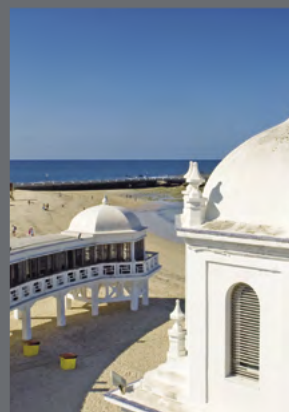
Sedes del Instituto Andaluz del Patrimonio Histórico en el monasterio de la Cartuja de Sevilla y del Centro de Arqueología Subacuática en el balneario de la Palma en Cádiz.