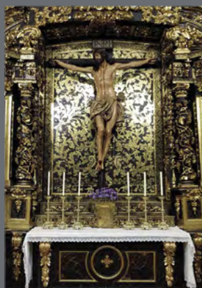
El Cristo de la Agonía, obra de Juan de Mesa, fue intervenido por el IAPH en 2017 y posteriormente devuelto a la parroquia de San Pedro de Ariznoa en la localidad de Bergara (Guipúzcoa).