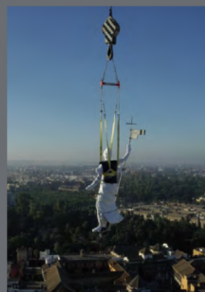
Puerta de Córdoba (Carmona) y Giraldo, proyectos de restauración llevados a cabo por el IAPH.