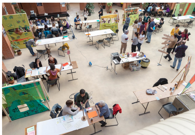
Talleres de prototipado en Puente de Vallecas Experimenta , 2019

La rendición de cuentas es inevitable cuando nos referimos a iniciativas facilitadas o promovidas desde la Administración Pública. Pero, ¿cómo medir la gestión y eficiencia de estos recursos públicos en procesos más experimentales cuyo objetivo es generar un contexto propicio para la innovación ciudadana, abierto, inclusivo, deliberativo, etc.? Gran parte de la sociedad desconoce qué objetivos persiguen los laboratorios ciudadanos, qué dinámicas promueven y qué impacto buscan generar, y es en este aspecto en el que su evaluación adquiere una especial relevancia, ya que el desconocimiento puede llevar a la desconfianza hacia estos espacios.