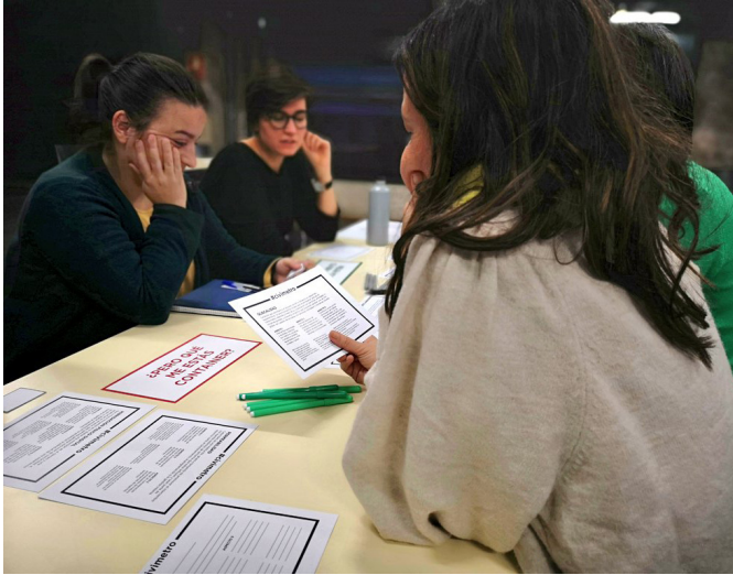
Taller Civimetro-Kick Off , 2020. Talleres de ideación colectiva con agentes especializados en mediación cultural, innovación ciudadana y medición de impacto y evaluación de programas culturales

Consideramos de vital importancia para la pervivencia de este tipo de centros mejorar sus sistemas de medición y evaluación. Qué medimos, qué dejamos fuera de la evaluación, cómo se publican esos datos, son preguntas que deberemos responder, y cuyas respuestas marcarán las narrativas sobre las que se articula la actividad de estos centros. En un momento como el que estamos, de innovación en la gestión pública y en la producción cultural, vemos la necesidad de innovar también en la definición de nuevas narrativas activadas desde lo común.