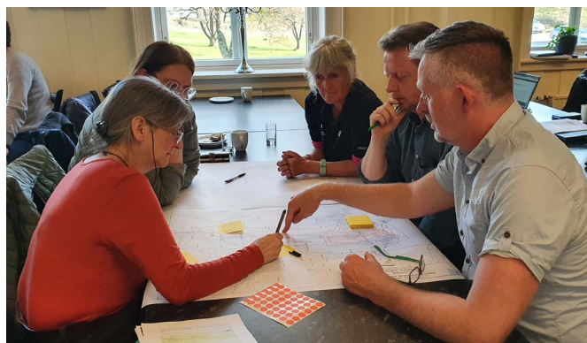
Talleres de evaluación de impacto sobre sitios Patrimonio Mundial realizados en Rjukan (Noruega) en 2022

Aprender de los compañeros y de sus experiencias es un elemento esencial para que las capacidades se desarrollen de forma adecuada. El aprendizaje es más eficaz y aplicable cuando se basa en que los participantes compartan el trabajo que realizan y aprendan enfoques