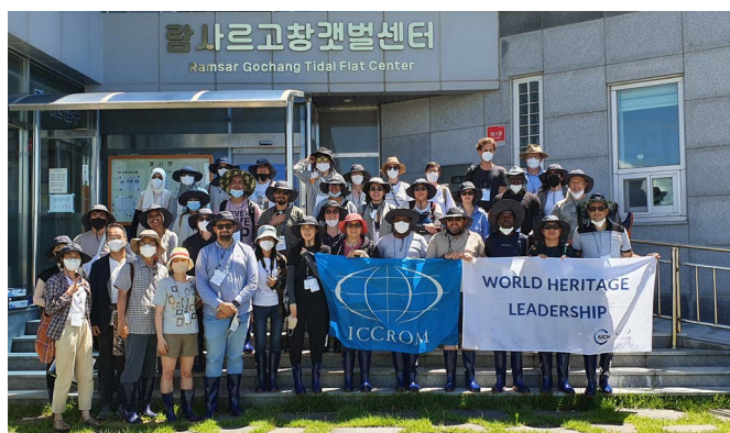
Participantes y profesionales en el curso de PNC en Corea del Sur en 2022

y soluciones aplicados en diversos lugares Patrimonio y comprendan los diferentes marcos de protección. El WHLP ha estado trabajando junto con el país anfitrión de cada sesión anual del Comité y el Centro del Patrimonio Mundial, en la coordinación del Foro anual de Gestores de Sitios Patrimonio Mundial. Como evento de creación de redes y desarrollo de capacidades, en sus últimas cuatro ediciones, el Foro ha reunido a más de 250 coordinadores de sitios Patrimonio Mundial de todo el mundo.