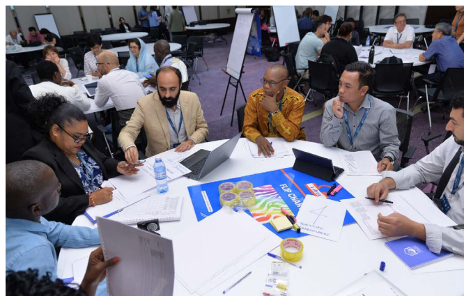
Grupo de trabajo durante el Foro de Gestores de Sitios del Patrimonio Mundial en 2019 en Bakú, Azerbaiyán

El desarrollo de capacidades en materia de gestión eficaz también está presente a través de los cursos y talleres llevados a cabo. Gestión del Patrimonio Mundial: Personas, Naturaleza, Cultura 2 , también conocido como PNC, es el curso insignia del WHLP que promueve un “enfoque de lugar Patrimonio” para su gestión. Se cen-