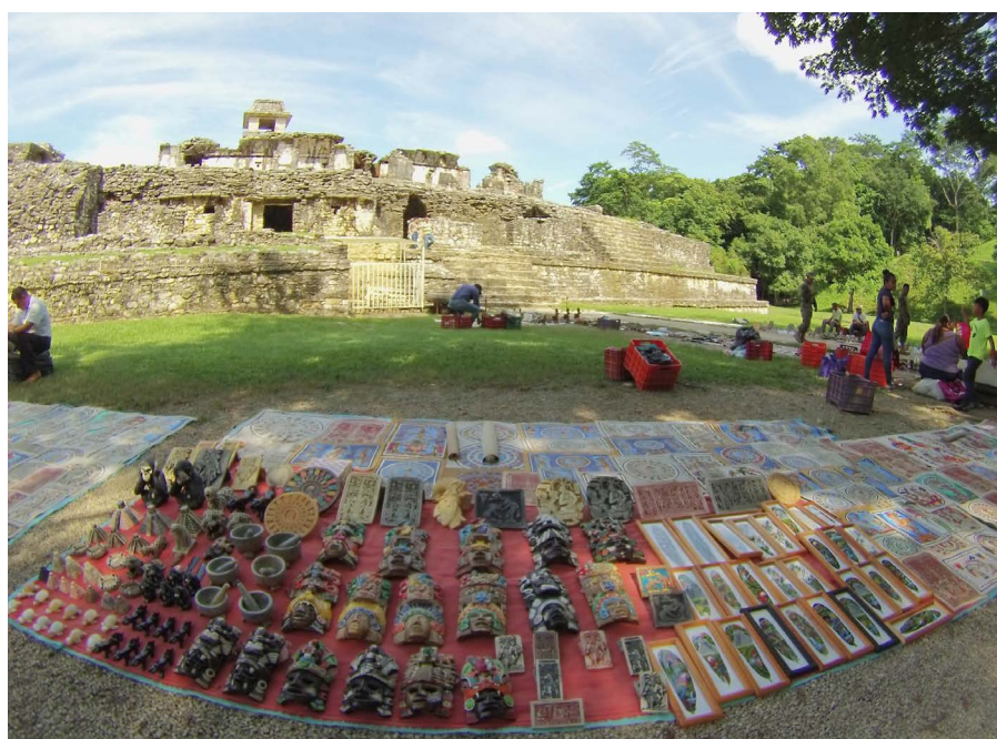
Comercio semiambulante en el área de monumentos

El interés de las poblaciones locales por los beneficios económicos del turismo entra en conflicto con las políticas aplicadas por el INAH para la conservación de los bienes patrimoniales. Durante el trabajo de campo documenté el almacenamiento, transporte, exhibición y venta de diversas artesanías y productos dentro del área de los monumentos, según lo permitido por las autoridades. La precariedad observada en las comunidades se refleja también en el ejercicio de actividades comerciales, incluyendo el trabajo de niños y ancianos. También es notable el abandono de los estudiantes en favor del trabajo en la industria turística como guías turísticos o en