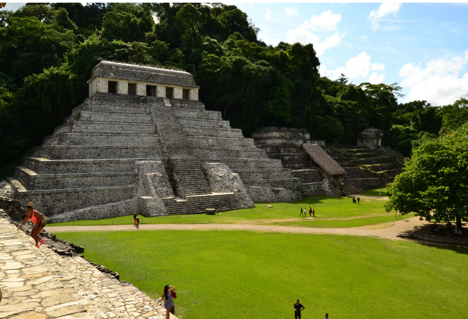
Templo de las Inscripciones de Palenque | foto Amilcar Vargas