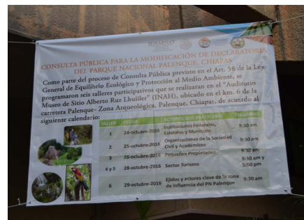
Pancarta de la CONANP para la consulta pública de 2016 para la modificación de declaratoria del Parque Nacional de Palenque

La complejidad social, económica y política de las comunidades locales de Palenque requiere de una estrategia a largo plazo que incluya la participación de la comunidad en el diseño, implementación, monitoreo y evaluación con base en las Directrices Operativas para la aplicación de la Convención del Patrimonio Mundial. México, como Estado parte de la Convención, tiene el compromiso de cumplir con este acuerdo internacional dentro de su territorio y de establecer mecanismos para asegurar la conservación de los bienes inscritos en beneficio de las generaciones posteriores, así como de la actual. En base a los resultados obtenidos y a la normativa internacional, nacional y local analizada, se proponen tres acciones de gestión para incrementar el impacto de la inscripción de Palenque: