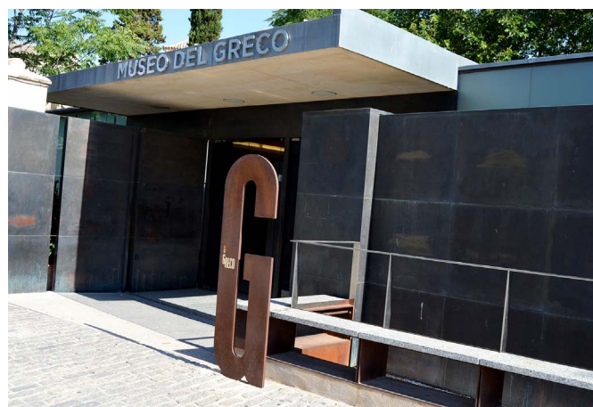
El Museo del Greco enriquece la oferta turística de la ciudad (2018), declarada Patrimonio Mundial en 1986

La gestión turística del patrimonio es el conjunto de actividades que involucran bienes culturales y naturales para diseñar y comercializar productos, servicios y experiencias turísticas. Estas actividades representan una sinergia de especial interés en la gestión patrimonial. Especialistas y expertos de ambas disciplinas y sectores trabajamos para encontrar un equilibrio simétrico que permita alcanzar los resultados deseados por ambas partes; pero, desafortunadamente, no siempre se logra. La relación que se origina entre patrimonio y turismo es dinámica e interdependiente: está en constante cambio y se necesitan mutuamente.