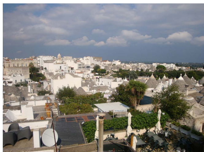
Vista de Alberobello (Italia) desde una terraza

El adjetivo excepcional está más próximo a la realidad que el adjetivo representativo , tanto para la ciudadanía en general, como para las personas e instituciones responsables de la gestión y la conservación de otros bienes con los que, aparentemente, se pudiesen tener puntos en común por su tipología, características o proximidad y con los que sería posible establecer posibles alianzas y sinergias. Son considerados bienes que están a otro nivel y, por tanto, con unas características muy particulares al resto de bienes protegidos, de tal manera que no son tomados como referentes. La gestión y protección de bienes similares no inscritos queda totalmente ajena al no identificarse semejanzas. No son ejemplo porque no se considera que haya igualdad de condiciones. Más