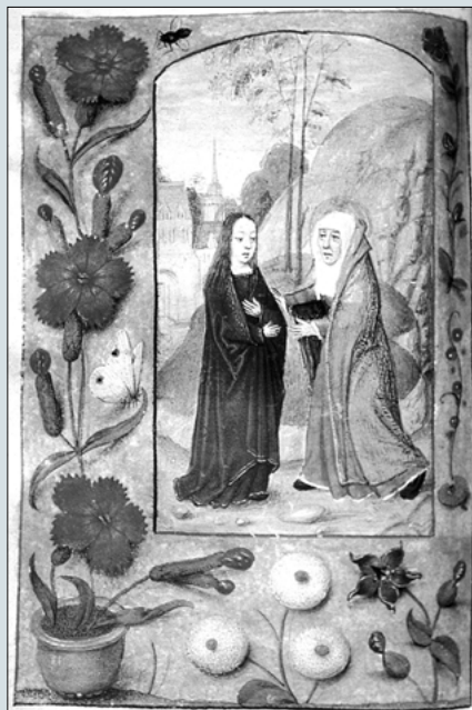
2. Biblioteca Capitul: Libro de Horas de Isabel Católica

A pesar de ser una biblioteca de origen dieciochesco, cuenta también con importantes ejemplares de los siglos XVI y XVII, como la magnífica edición de Plantino de la Biblia regia de B. Arias Montano.