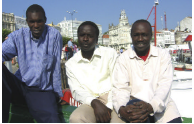
Foto 1: Algunos pescadores senegaleses que trabajan en la pesca artesanal A Coruña