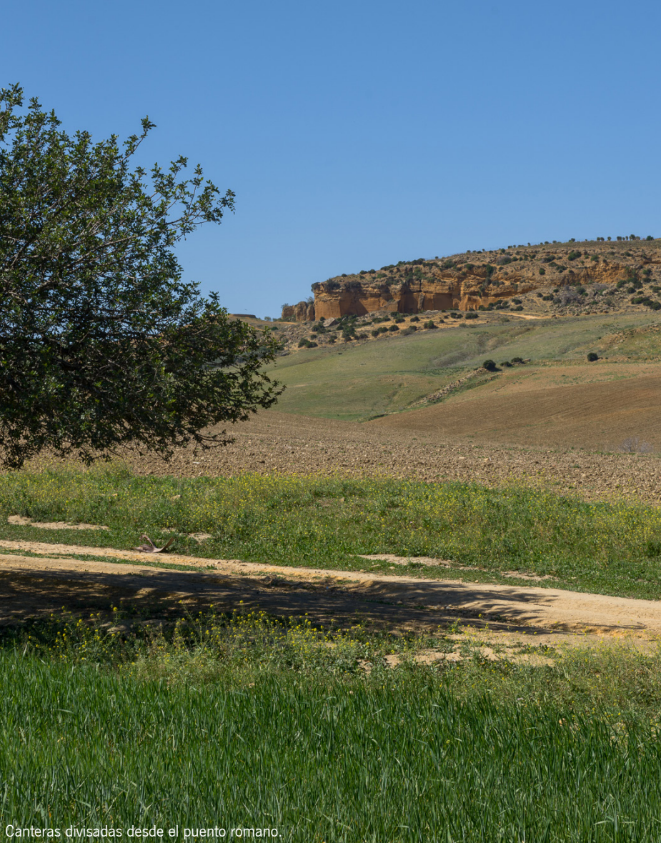
Canteras divisadas desde el puente romano.

la financiación de la construcción de numerosos edificios religiosos (conventos e iglesias) y nobiliarios (palacios), que pueden seguir contemplándose en el centro de la localidad, siendo especialmente notable la influencia barroca, por la cercanía y dependencia del centro sevillano, manifestada en la arquitectura, la pintura, la orfebrería y la escultura.