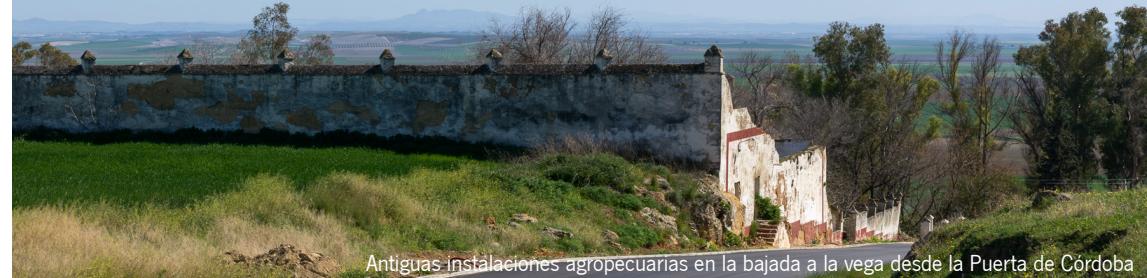
Antiguas instalaciones agropecuarias en la bajada a la vega desde la Puerta de Córdoba