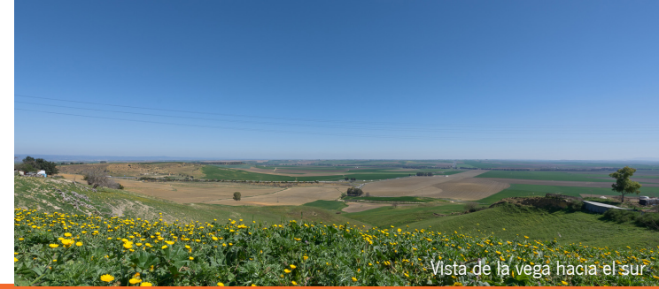
Vista de la vega hacia el sur