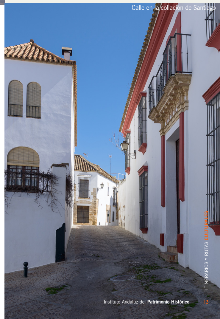
Calle en la collación de Santiago

■ ZOIDO NARANJO, F. y RODRÍGUEZ RODRÍGUEZ, J. (Coords.) (2015). Los Alcores y la Vega de Carmona. Catálogo de Paisajes de la Provincia de Sevilla, Sevilla . Centro de Estudios de Paisaje y Territorio, Consejería de Medio Ambiente y Ordenación del Territorio de la Junta de Andalucía.