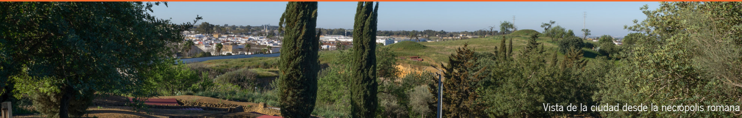
Vista de la ciudad desde la necrópolis romana