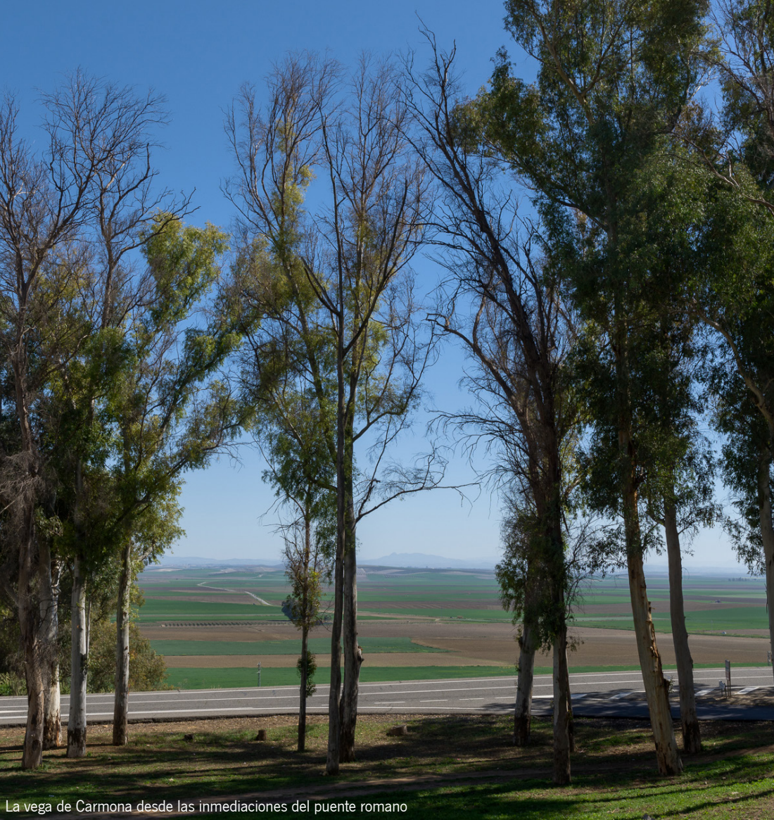
La vega de Carmona desde las inmediaciones del puente romano