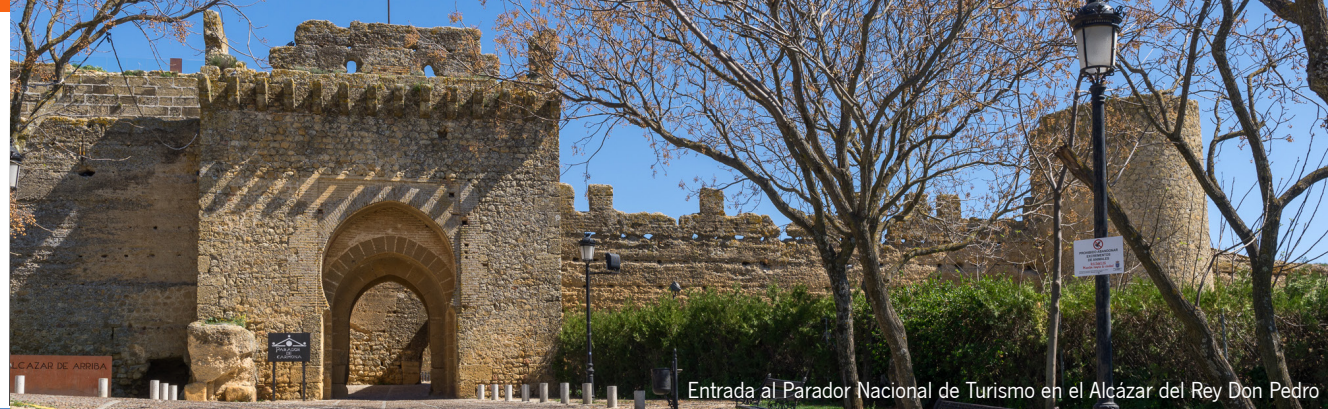
Entrada al Parador Nacional de Turismo en el Alcázar del Rey Don Pedro