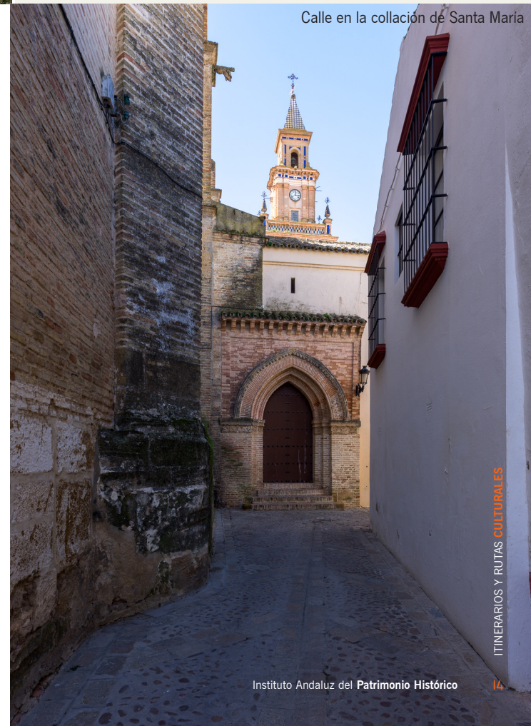
Calle en la collación de Santa María