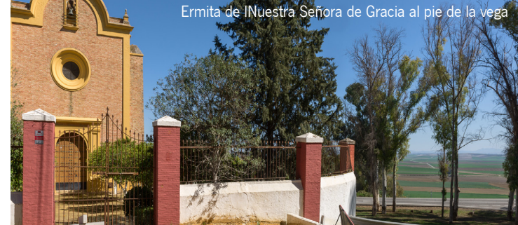
Ermita de Nuestra Señora de Gracia al pie de la vega