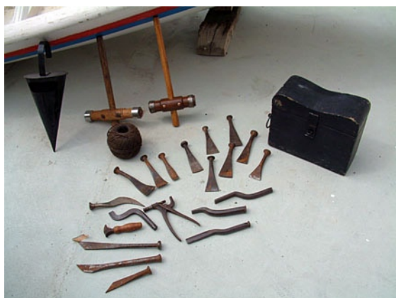
Juego de herramientas de carpintería de ribera.

A sus valores históricos hay que sumar la clara vocación de dichos Astilleros por transmitir los conocimientos de esta actividad tradicional,