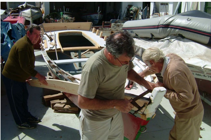
Reparación de una jábega.