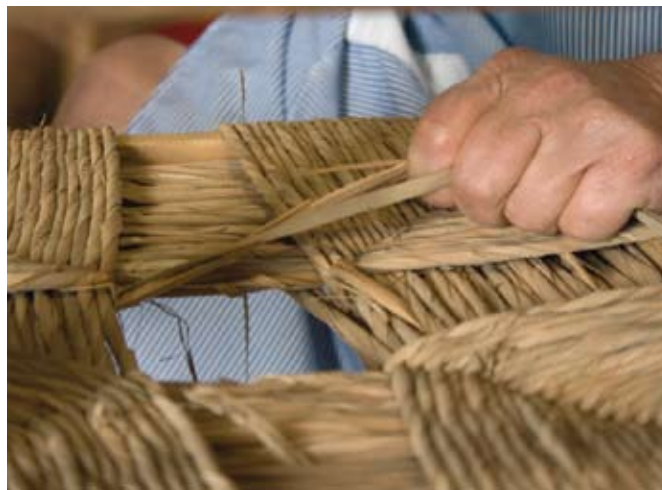
Sillería. Trabajo de eene en Guadalcanal, Sierra Norte de Sevilla.