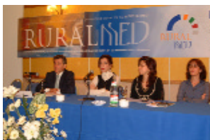
Mesa redonda sobre experiencias innovadoras y clausura de las jornadas

1. El Patrimonio del medio rural en cualquiera de sus categorías (arquitectónico, natural, etnológico...) representa: