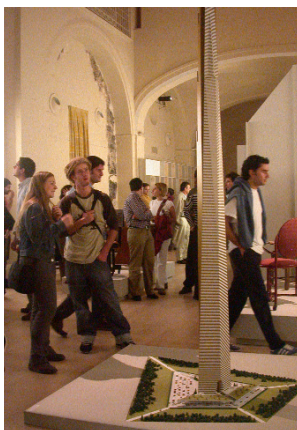
Detalle de la exposición Frank Lloyd Wright. The Living City