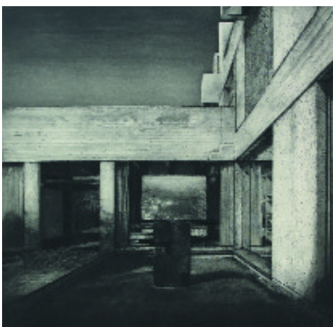
"Patio de la Fundación Joan Miró", de Álvaro Toledo Ruiz

En todos los casos son artistas de un reconocido prestigio y trayectoria, avalada ya con otros premios y distinciones. Se han seleccionado, además, una treintena de obras, entre las cerca de doscientas que se han presentado al certamen, para formar parte de la exposición que se inauguró el pasado mes de enero (16 de enero al 19 de marzo). Resulta relevante la importante calidad de las obras presentadas, de una ajustada precisión técnica y excelente adecuación creativa, apreciándose cada vez más la presencia de nuevas tecnologías en la realización de las obras. Esta muestra reunió una completa panorámica de lo que es en la actualidad la obra gráfica en España.