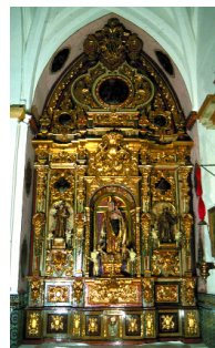
Iglesia de la Asunción. Húevar del Aljarafe. Sevilla Signatura: 10/0034126 al 10/0034234