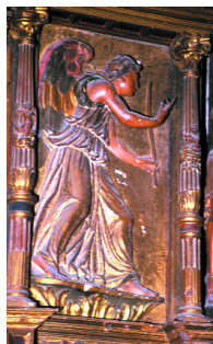
Iglesia de San Martín. Sevilla Signatura: 10/0033673 al 10/0033838