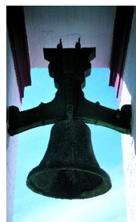
Iglesia de Santa María. Sanlúcar la Mayor. Sevilla Signatura: 10/0034609 al 10/0034858