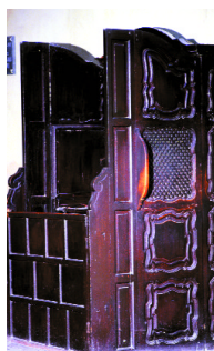
Iglesia de San Miguel. Morón. Sevilla Signatura: 10/0034368 al 10/0034608