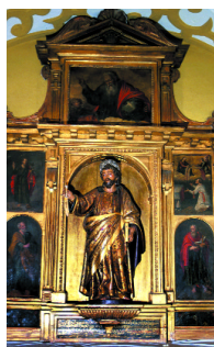
Parroquia de San Juan Bautista Signatura: 10/0034296 al 10/0034367