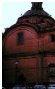
Iglesia Ntra. Sra. de la Consolación. Umbrete. Sevilla Signatura: 10/0033839 al 10/0033967