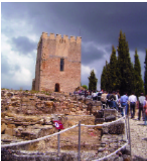
Visita a la Fortaleza de la Mota. Alcalá la Real, Jaén

Los días 26, 27 y 28 del pasado mes de mayo tuvo lugar en Alcalá la Real (Jaén) la tercera edición de las Jornadas Temáticas Andaluzas de Arqueología, bajo el título Los Castillos. Reflexiones ante el reto de su conservación . Organizadas por la Dirección General de Bienes Culturales de la Consejería de Cultura de la Junta de Andalucía, las jornadas se plantearon como objetivo exponer y establecer un debate sobre los criterios metodológicos de intervención sobre estos bienes culturales de especial significación en el marco patrimonial andaluz, así como sobre los resultados de las actuaciones de conservación, restauración y puesta en valor llevadas a cabo sobre ellos.