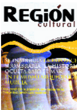
Detalle de portada del primer número del boletín Región Cultural

Región Cultural Consejería de Educación y Cultura Correo-e.: region.cultural@carm.es