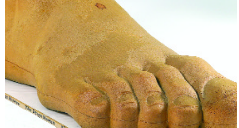
Up 7 II Piede (Gaetano Pesce, 1969. Espuma de poliuretano)

o contactar con la restauradora Kathrin Kessler (Kathrin.Kessler@design-museum.de).