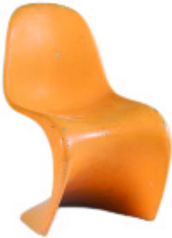
Silla Pantón (Verner Panton, 1958-67. Fibra de vidrio reforzada lacada)