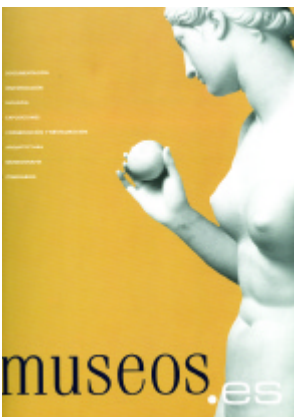
Portada de la nueva revista

PH Boletín del IAPH da la bienvenida a la revista Museos.es, nueva publicación de periodicidad anual promovida por la Subdirección General de Museos Estatales del Ministerio de Cultura cuyo número 0 (2004) cumple unos de los objetivos del Plan Integral de Museos Estatales: el anhelo de fomentar el diálogo entre los profesionales de museos del ámbito nacional e internacional, y el intercambio de experiencias museísticas a través de muy diferentes canales. La revista nace como foro abierto y constante de debate entre los profesionales de museos, para aportar a su vez un renovado punto de vista en el panorama editorial ya existente.