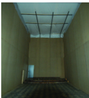
Capilla de San Telmo. Imagen de la protección de los retablos y de la bóveda

También se han protegido dos marcos de gran formato, que tuvieron que ser desmontados en el transcurso de la fase previa de intervención.