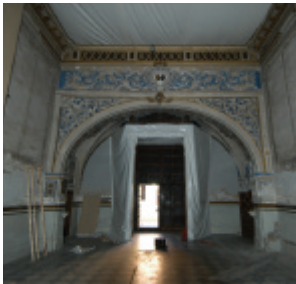
Capilla de San Telmo. Cancel de entrada tras la protección

Esta protección, necesaria antes de proceder a cualquier tipo de intervención en el edificio, ha consistido en: