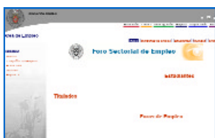
Área de empleo de la Fundación General Complutense

Información recopilada por el Departamento de Formación del Instituto Andaluz del Patrimonio Histórico sobre convocatorias de becas relacionadas con patrimonio y cultura. Para recibir individual y periódicamente las actualizaciones en el correo-e. Hay que darse de alta en el servicio de alerta informativa, en la dirección: www.juntadeandalucia.es/cultura/iaph/documentacion/documentacion.html