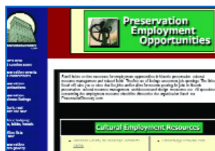
Portal Preservation Directory