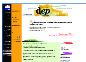
Ministerio de Cultura y Comunicación francés

Ante la falta de páginas web específicas de patrimonio y empleo, además de información relacionada directamente con este tema, ofrecemos una recopilación de direcciones de sitios en Internet que contienen información y recursos útiles, aunque más genéricos, en materia de empleo.