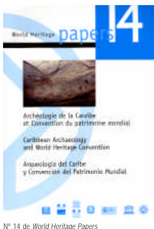
Nº 14 de World Heritage Papers

Del 20 al 23 de septiembre de 2004, el Centro de Patrimonio Mundial de la Unesco organizó en Fort-de-France, Martinica, un seminario internacional con representantes oficiales y expertos de la Arqueología Caribeña para avanzar una Identificación de los Sitios Arqueológicos del Caribe susceptibles de ser objeto de un proceso de candidatura para una inscripción en la Lista de Patrimonio Mundial. Las conclusiones de las reuniones mantenidas durante el seminario, así como las ponencias pronunciadas se han recopilado en el volumen nº 14 (2005) de World Heritage Papers, consultable en http://whc.unesco.org/documents/publi_wh_papers_14_en.pdf bajo el título Arqueología del Caribe y Convención del Patrimonio Mundial.