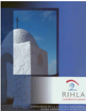
Carteles de los proyectos Valor FT y RIHLA. Las huellas de la memoria

La Dirección General de Bienes Culturales ha organizado una exposición itinerante titulada Las rutas de la memoria , que se enmarca en el Proyecto RIHLA. Las Huellas de la Memoria (Programa INTERREG III A Andalucía – Marruecos). Se trata de un proyecto de investigación y difusión sobre el patrimonio cultural común del territorio de ambas orillas del Mediterráneo, que tiene como subtítulo definidor el de Itinerarios de la Cultura Inmaterial entre Andalucía y Marruecos .