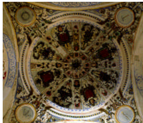
Iglesia y Convento de Santo Domingo. Archidona, Málaga