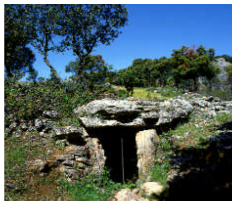
Poblado y necrópolis megalítica Peña de los Gitanos. Detalle. Montefrío, Granada

Selección realizada por Elisenda Murillo