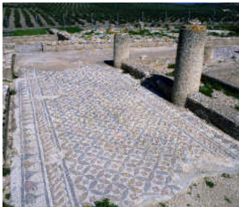
Villa romana de Bruñel. Detalle de solería. Quesada, Jaén

Signatura: 70/0040572 - 70/0042588 Nº de imágenes: 1.906 Formato digital: JPG Modo de ingreso: Cesión Disponibilidad (consulta): uso privado