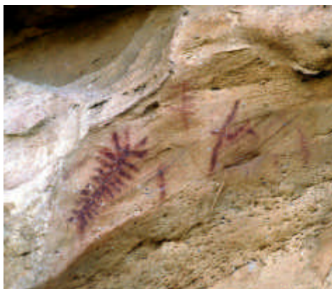
Abrigos de Peñas Cabrera. Casabermeja, Málaga