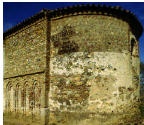
Iglesia de San Mamés. Aroche, Huelva