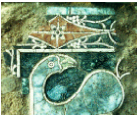
Zona Arqueológica de la Villa Romana de la Estación. Antequera, Málaga