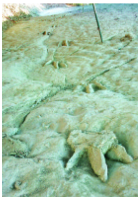
Rastro de Costalomo. Fuente: Museo de Salas de los Infantes, Burgos

A finales del pasado año, y con la clara voluntad de apoyar la candidatura presentada a la UNESCO de las IDPI (Icnitas de Dinosaurios en la Península Ibérica), la Fundación del Patrimonio Histórico de Castilla y León celebró el simposio internacional Huellas que perduran. Icnitas de DINOSAURIOS: patrimonio y recurso, cuyas actas precisamente se publican en estos días (información en www.fundacionpatrimoniocyl.es ).