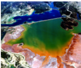
Sitio Histórico de Ríotinto. Dique de aguas ácidas