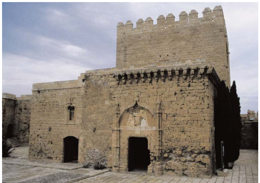
Portada gótica de la Torre del Homenaje. Alcazaba y Murallas del Cerro de San Cristóbal (Almería)

La BDI renovada incorpora información específica sobre los conjuntos históricos de Andalucía, que no estaban en la anterior aplicación